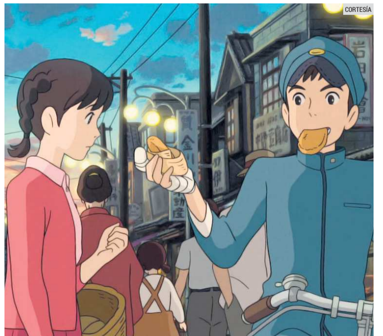
"LA COLINA DE LAS AMAPOLAS". La animación de Studio Ghibli es una excelente opción para este 26 de febrero en el MAZ.

El hotel se encuentra en Av. Niños Héroes 125, zona Centro de Guadalajara.