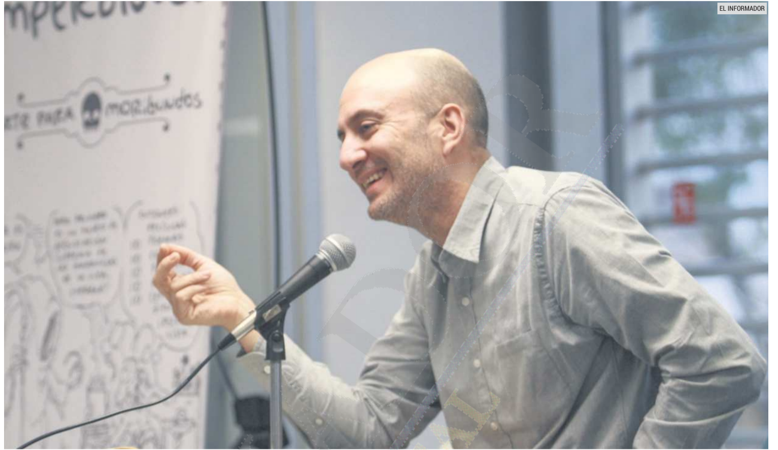
JIS. El artista visual se ha logrado acoplar a proyectos en equipo, sin perder jamás su estilo.

Ahora, un "evento mayor" en la trayectoria creativa de Jis, "la llegada de internet fue una especie de bomba atómica que no nos per-